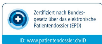
Abbildung 1: Zertifizierungszeichen